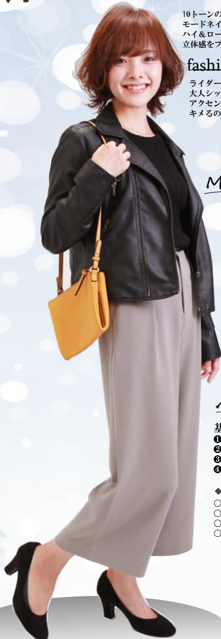
style: 笹川洋志 total coordinate: 清由佳 model: Miyukiさん

ライダーズ×モノトーンコーデで大人シックな雰囲気。アクセントにバッグをカラーでキメるのがGOOD!